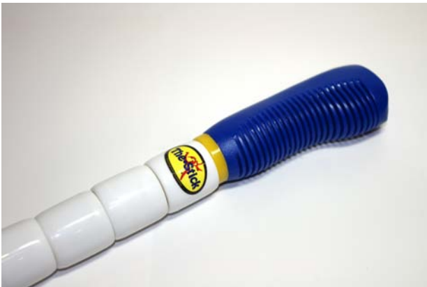
ロングスティック(長さ60cm:色/青)