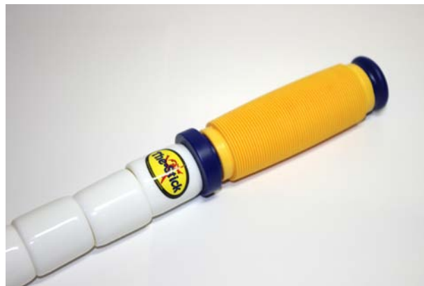
ショートスティック(長さ50cm:色/黄)